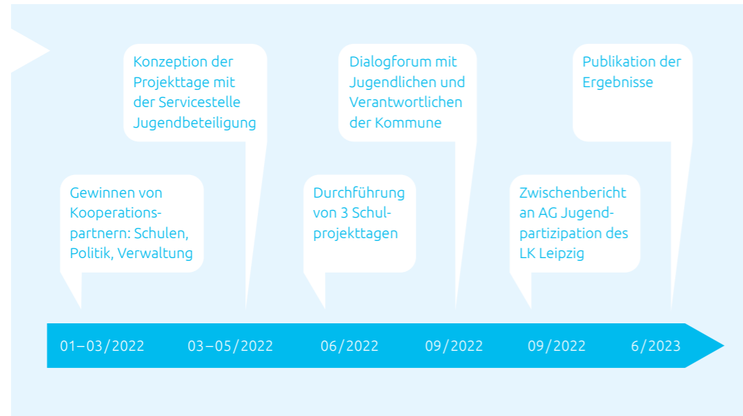
Abb. 1: Zeitlicher Ablauf des BiSMit-Beteiligungsformats

mit dem Landkreis Leipzig durchgeführt wurde. Das Ziel bestand dabei nicht in der Ableitung konkreter, mit den Jugendlichen umzusetzender Projektvorhaben, sondern in der Bestimmung von Interessengebieten und Handlungsfeldern, welche bei der Erarbeitung eines kreisweiten Jugendbeteiligungskonzepts (siehe Kapitel 3.3) berücksichtigt werden könnten.