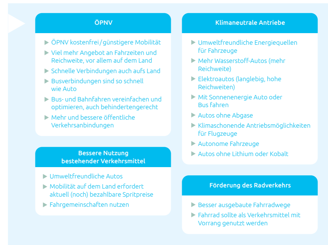
Abb. 5: Ideensammlung im Handlungsfeld Mobilität