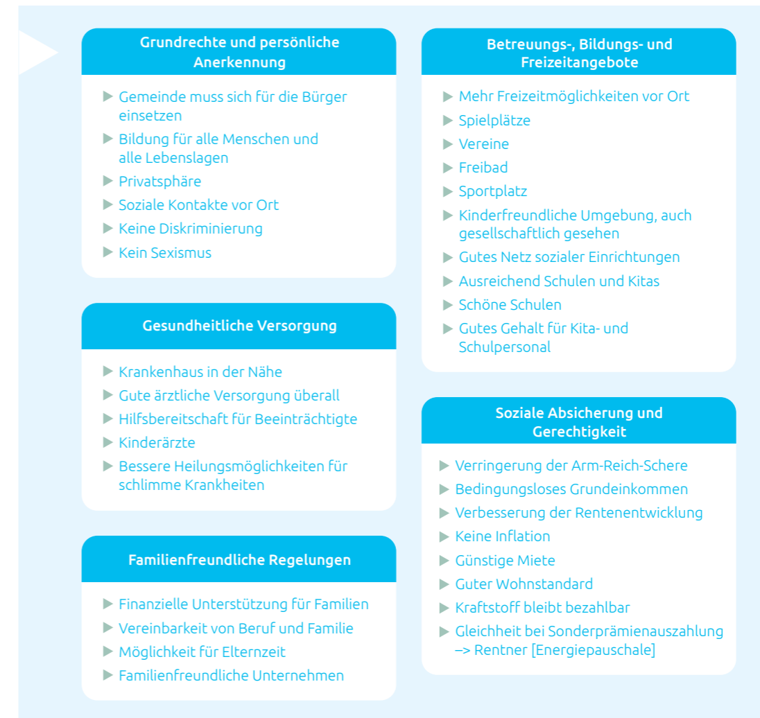
Abb. 7: Ideensammlung im Handlungsfeld Familie und Soziales

Neben den bereits im Handlungsfeld Bevölkerungsentwicklung thematisierten Bildungs-, Betreuungs- und Freizeiteinrichtungen rückte hier noch-