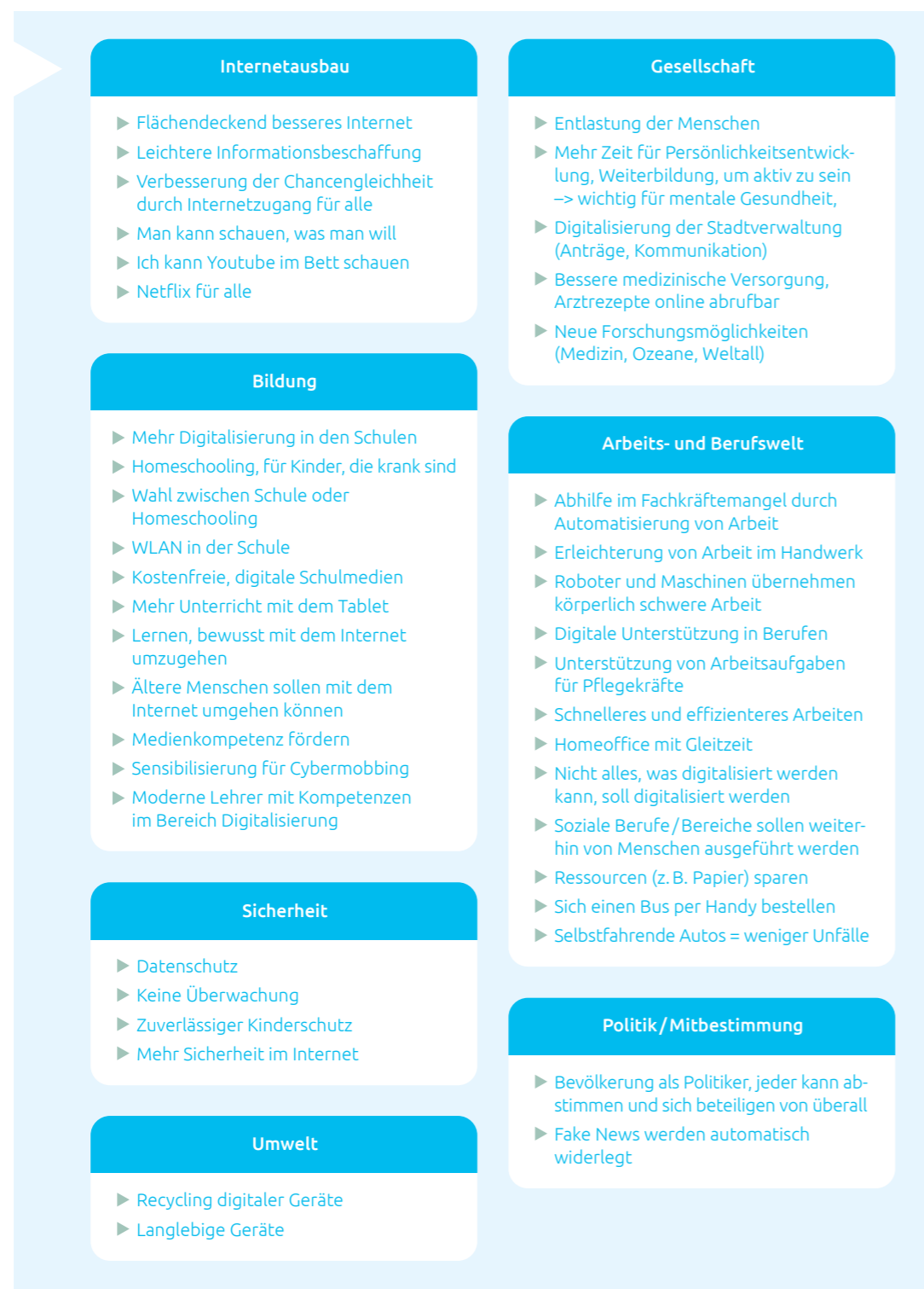
Abb. 3: Ideensammlung im Handlungsfeld Digitalisierung

Internet sowie Erfahrungen aus dem pandemiebedingten Homeschooling. In der Berufsschulklasse (teilweise hatten die Teilnehmenden bereits eigene Familien) kamen verstärkt Bedürfnisse nach vereinfachten digitalen Verfahren im Umgang mit Ärzten und Behörden, Erleichterungen in der Arbeitswelt sowie Entlastungen im Familienalltag (viele können online erledigt werden) zur Sprache.